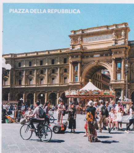
PIAZZA DELLA REPUBBLICA