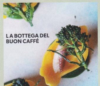
LA BOTTEGA DEL BUON CAFFÉ

1/ PIAZZA SANTO SPIRITO Het stikt van de gezellige pleintjes, dus struin gewoon rond en ontdek je eigen favoriet. Het zonnige Piazza Santo Spirito is een fijne plek om met een Aperol Spritz op 't terras te zitten. En op zondag is er een antiekmarkt.