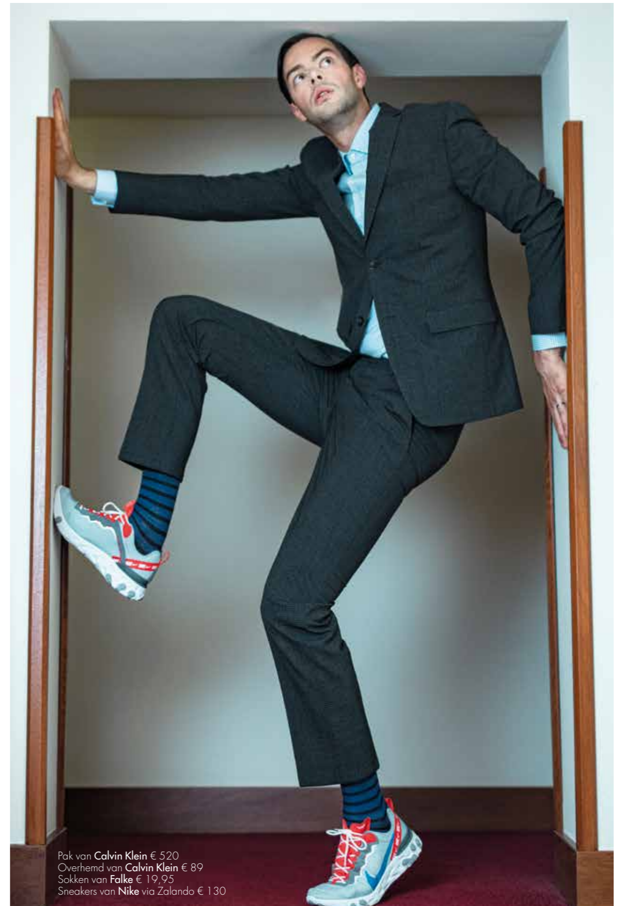
Pak van Calvin Klein € 520 Overhemd van Calvin Klein € 89 Sokken van Falke € 19,95 Sneakers van Nike via Zalando € 130