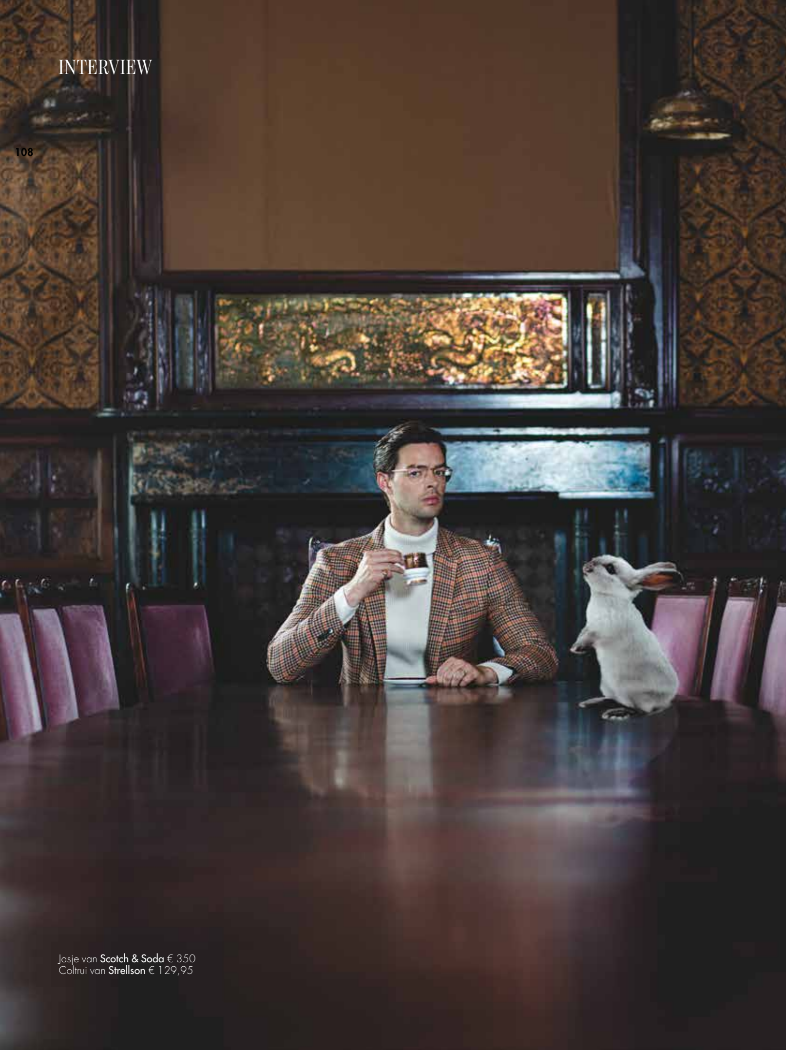
Jasje van Scotch & Soda € 350 Coltrui van Strellson € 129,95