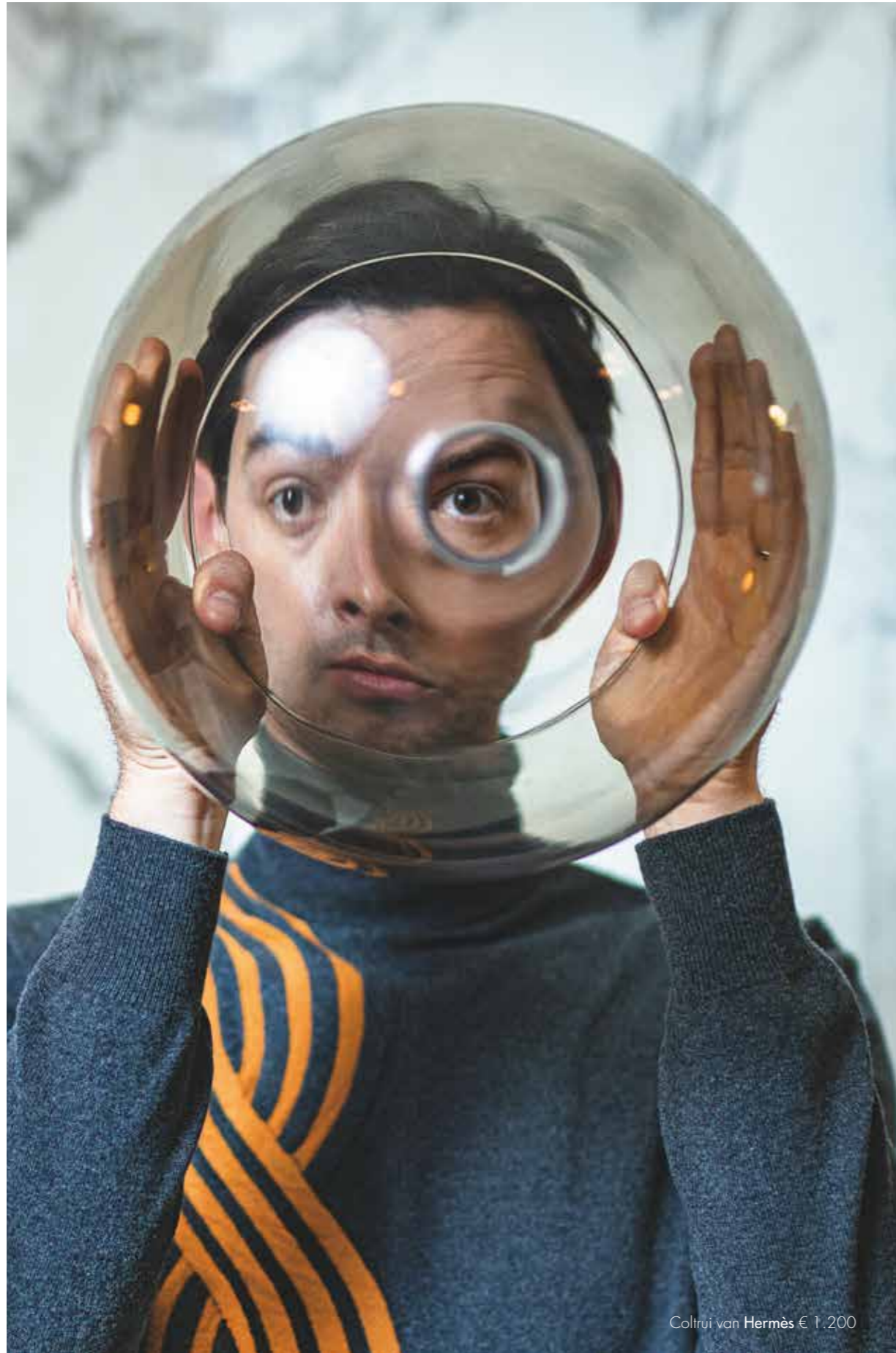
Coltrui van Hermès € 1.200

Jas van Scotch & Soda prijs op aanvraag Coltrui van Strellson € 129,95 Broek van Scotch & Soda € 109,95 Sokken van Falke € 19,95 Schoenen van Fratelli Rossetti € 549